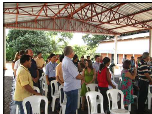
Momentos de celebração da missa campal.

O barracão do estacionamento ficou tão bonito, que até parecia que teríamos um casamento.