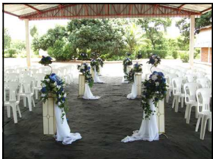
Estacionamento, local onde foi rezada a missa