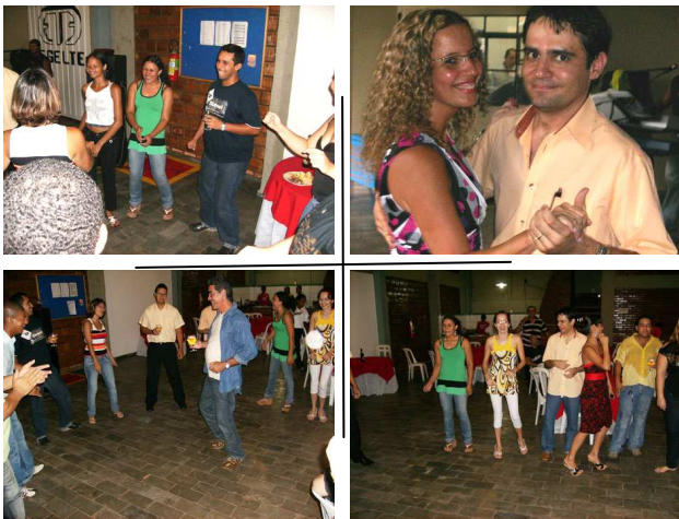
Momentos de muita dança

A música rolou solta e a moçada seguiu animadíssima.