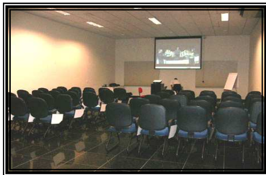
Auditório do Hotel Metropolitan

O Encontro foi realizado no Hotel Metropolitan, com toda a infra-estrutura necessária, em razão do porte do evento. Foram quarenta e cinco participantes, sendo trinta e oito engenheiros.