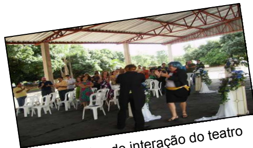
Momentos de interação do teatro

Como não podia deixar de ser, este mês o evento proporcionou muita alegria, descontração, mas também teve seus momentos de serenidade nos remetendo a reflexões quanto às nossas conquistas enquanto profissional, enquanto uma equipe, enquanto Egelte...., tudo simploriamente exaltado por Curumins Cia Teatral (ONG que está há 25 anos em atividade levando transmitindo mensagens sobre saúde, amizade, trabalho e qualidade de vida).