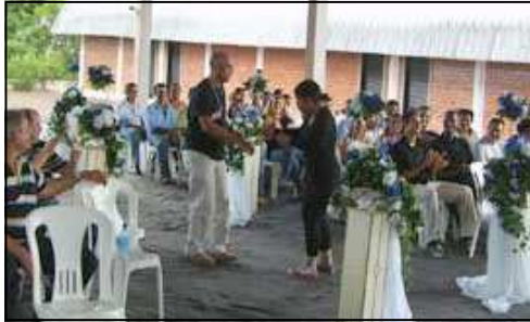
O Diretor de Administração e Finanças também caiu no samba.