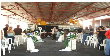
Benção do padre

O barracão do estacionamento ficou tão bonito, que até parecia que teríamos um casamento.