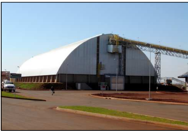
Unidade já em funcionamento