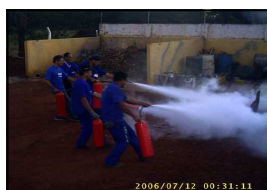
Mais uma simulação