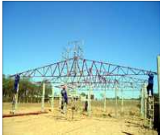
Barracão na fase de cobertura...

Ainda falta implementar a rede elétrica e uma caixa d'água.