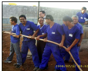
A simulação de incêndio