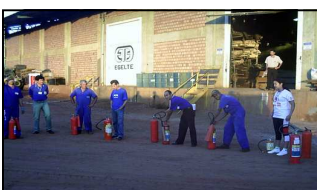
Atenção total nas instruções