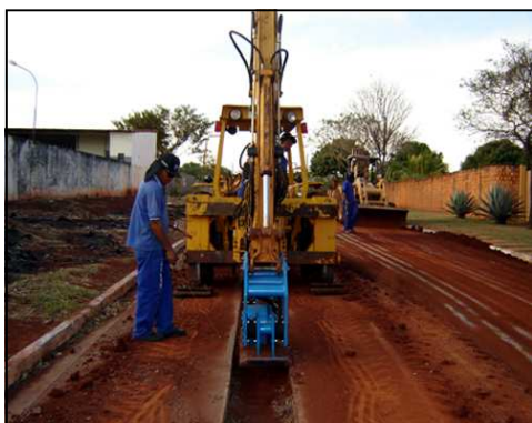
Máquinas em pleno vapor