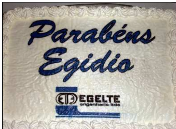
Bolo de aniversário em homenagem a empresa e ao Presidente