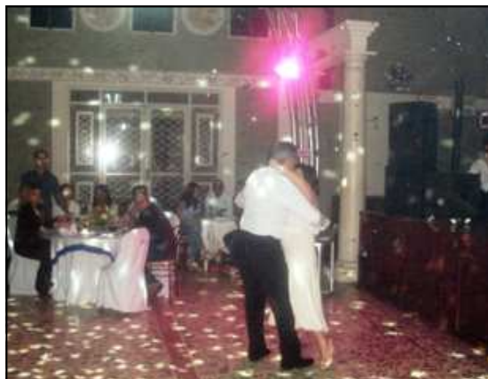
O Presidente "abriu" a pista de dança

Após as homenagens e o jantar o salão se transformou em uma animada pista de dança.