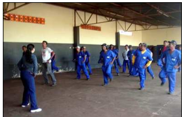
1º dia dos exercícios

“É um trabalho de prevenção de doenças causadas pela repetição diária de tarefas. Os empregados que atuam na área administrativa, por exemplo, estão suscetíveis a problemas posturais e musculares. Aqui na obra, desenvolvemos exercícios específicos para prevenir tendinites e cervicalgias (dores na região do pescoço), entre outras doenças”, explica a fisioterapeuta.