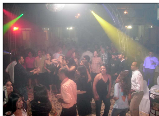
Todos curtindo o som do DJ