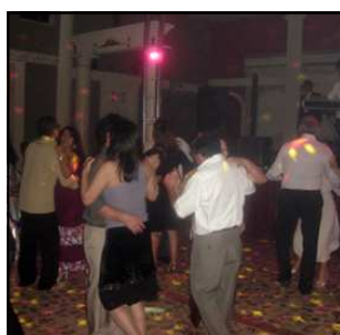
Os casais na pista