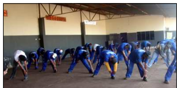
O resultado está sendo muito positivo