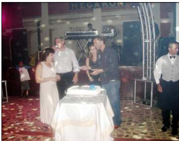
A hora dos parabéns

O presidente, após o discurso, recebeu os parabéns de todos os presentes. Em um telão foram transmitidas homenagens de familiares e colaboradores a Egelte e ao Presidente Egidio Comin.